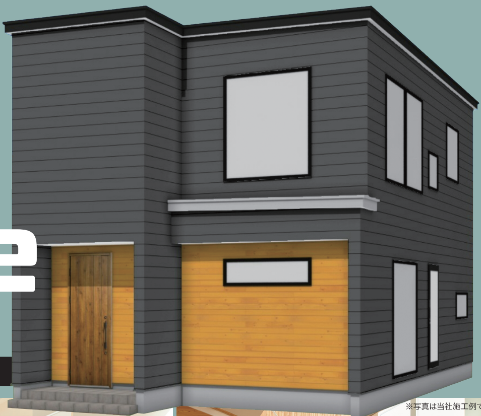
※写真は当社施工例です。